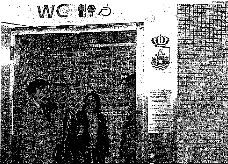
El alcalde, a la izquierda, y la concejal de Medio Ambiente escuchan las explicaciones de uno de los técnicos.

EQUIPAMIENTO En Valdelagrana, el Juncal, Calderón y la Puntilla